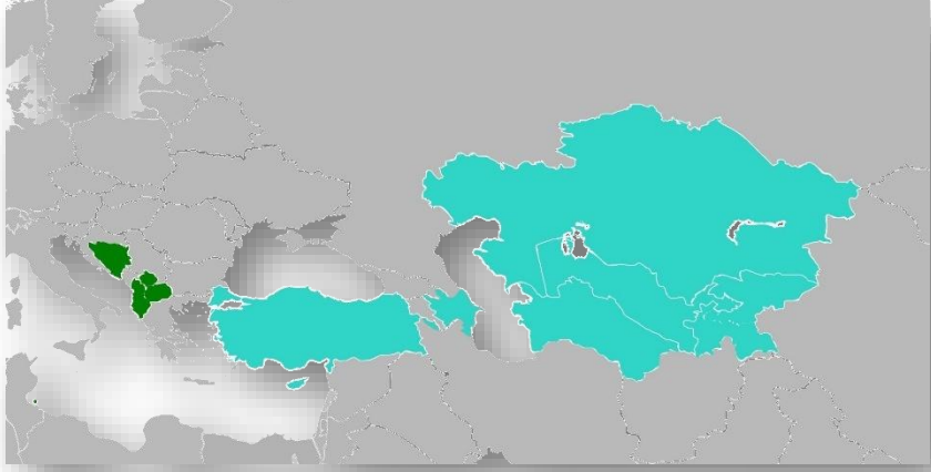
Harita 2 ABİF ve OABİF Devletleri